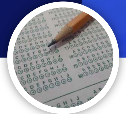
QUIZ / SOAL SE